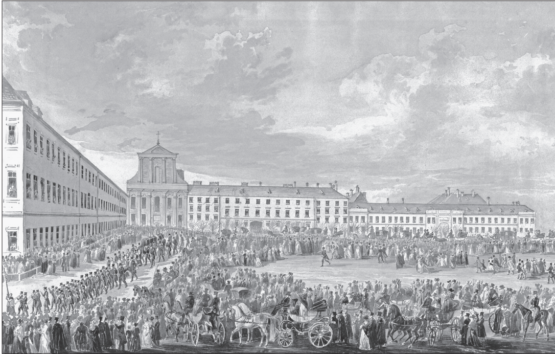
Abb. 1 Beethovens Leichenzug vor dem ehemaligen Schwarzspanierkloster in Wien, 1827 – Aquarell von Franz Xaver Stöber (1795–1858)

Um halb vier an diesem Nachmittag setzt sich unter einem hellblauen Frühlingshimmel der majestätische Trauerzug in Bewegung. Auf die Priesterschar folgt der reich geschmückte Sarg, getragen von acht Sängern der Hofoper. Acht Kapellmeister halten weiße Atlasbänder, die über den Sarg gelegt sind. Die Bahre ist von etwa vierzig Freunden und Künstlerkollegen umringt – Dichtern, Schauspielern, Komponisten und anderen Musikern –, unter ihnen Schubert, Czerny, Schuppanzigh und Grillparzer. Sie sind in feierliches Schwarz gekleidet, tragen schwarze Handschuhe, halten in der linken Hand eine weiße Lilie und in der Rechten eine mit Blumen verzierte Fackel. Ihnen folgt eine Abordnung von Schülern des Konservatoriums – die Schulen sind zum Zeichen der Trauer heute geschlossen; eine beeindruckende Menge angesehenen Persönlichkeiten beschließt den Zug.